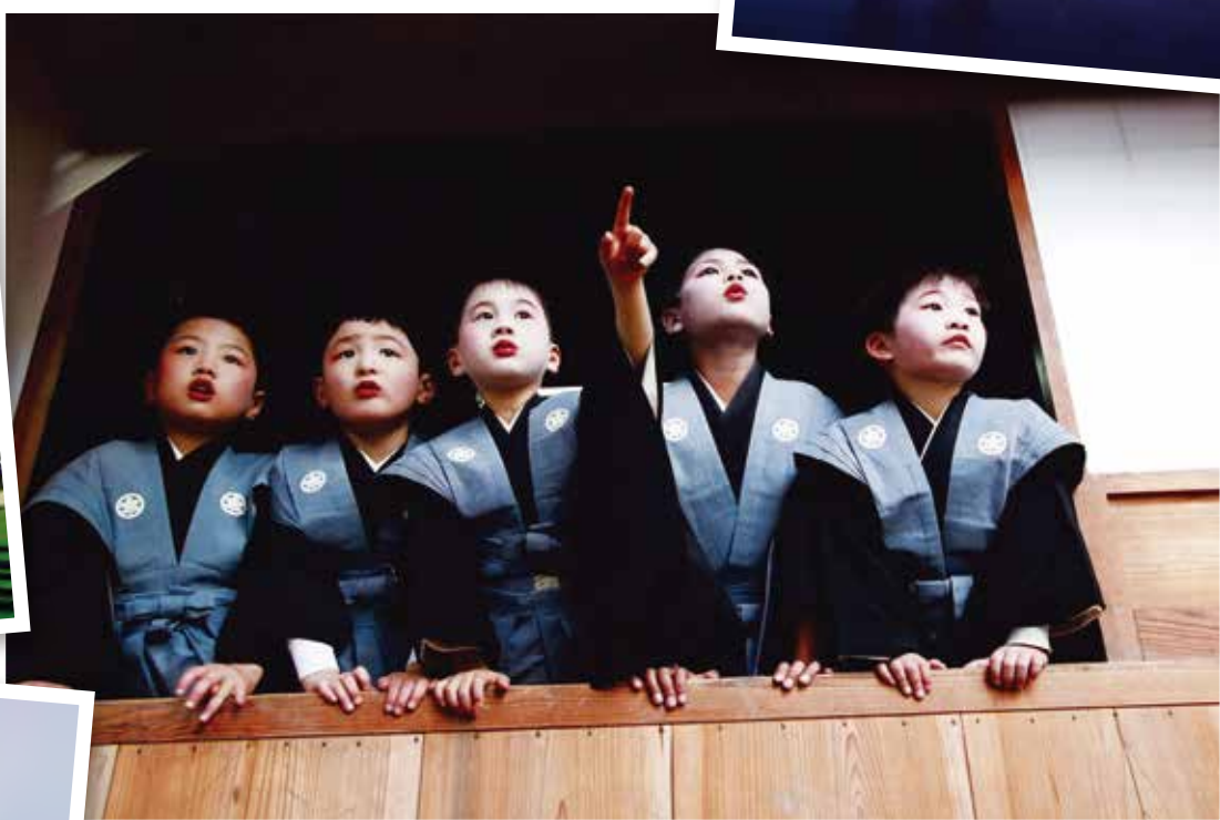
第9回「大好き!にいがた!」フォトコンテスト入選作品より